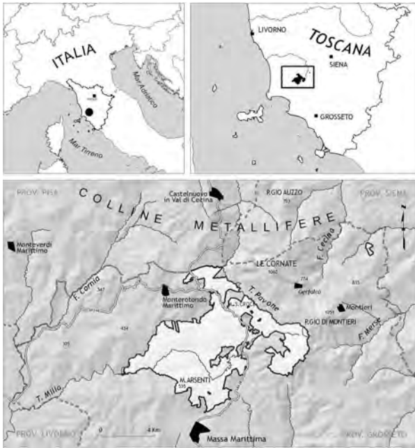
Fig. 1 Localizzazione dell'area di studio. Location of the study area.

Sotto l'aspetto litologico sono presenti formazioni assai diverse, sebbene la maggior parte dell'area di studio sia interessata dalle argilliti dei "Galestri e Palombini". Nella porzione centro-orientale ed in particolare alle quote più elevate affiora la serie toscana (SERVIZIO GEOLOGICO D'ITALIA, 1968, 1969) principalmente con le formazioni di "Calcere cavernoso", "Calcere massiccio" e "Calcere ad avicula". A Podere Filetto e a Poggio Bruciato sono presenti anche piccoli affioramenti di arenaria "Macigno". Nella porzione occidentale, tra Poggiarello e Serra Paganico compaiono i conglomerati nei quali è presente anche materiale non comune come apfite porfirica e porfido granitico (sughereta di Serra Paganico). Lungo i Torrenti Milia, Ritorto, Pavone sono presenti modesti depositi alluvionali recenti; nella zona di Monte Arseni si trovano depositi di travertino e al Podere i Piani depositi alluvionali terrazzati.